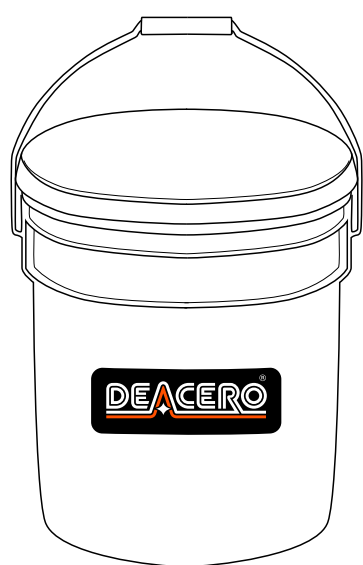
Cubetas de 25 y 50 kg